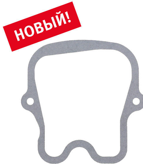
НОВЫЙ 638.901 – MAN 51.03905.0134 Материал: EWP 407 серый (мягкий материал)